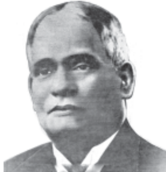
ചരിത്രരംഗത്തേക്ക് ചുവടുമാറ്റുന്നത്. ●

രിൽ ജനിച്ചു. അലഹബാദ് സർവ്വകലാശാലയിൽ നിന്നും ബിരുദമെടുത്ത കാശിപ്രദാസ് ഓക്സ്ഫോർഡ് സർവ്വകലാശാലയിലെ ജീസസ് കോളേജിൽനിന്നും 1909ൽ മാസ്റ്റർ ബിരുദം നേടി. തുടർന്ന് നിയമ ബിരുദമെടുത്ത ശേഷം കൽക്കട്ട ഹൈക്കോടതിയിൽ പ്രാക്റ്റീസാരംഭിച്ചു. പിന്നീട് 1916ൽ പട്നയിലെത്തുന്നതോടെയാണ്