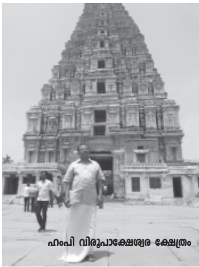
ഹംപി വിരുപാക്ഷേശ്വര ക്ഷേത്രം