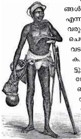
"Palmyra Tree Climber," from Samuel Mayner, Native Life in Travancore (London: W. H. Allen & Co., 1881).

പനകയറ്റവും കരുപ്പട്ടി നിർമ്മാണവും ഷാനാരിൽ ഒരു വിഭാഗത്തിന്റെ പരമ്പരാഗത തൊഴിലായിരുന്നു. പന കയറി അക്കാനി ഉത്പാദിപ്പിച്ച്, ശേഖരിച്ച് കൊണ്ടിറങ്ങുക എന്നത് ഏറെ ശ്രമകരമായ അധ്വാനമാണ്. അരിവാൾ പെട്ടി, ചുണ്ണാമ്പ് പെട്ടി, കടിപ്പ്, കലക്കുമട്ട, കൂടുവ, മുരുകുത്തടി എന്നിവ ഈ ജോലിക്ക് അവശ്യം വേണ്ടുന്ന ഉപകരണങ്ങളാണ്. കൂടുവ എന്നത് പനയോല കൊണ്ടുണ്ടാക്കിയ ഒരതലമാണ്. ഒരു തുള്ളി അക്കാനി പോലും ചോർന്നുപോകാതെ ഏഴ് ലിറ്റർ വരെ കൊണ്ടിറങ്ങാൻ കഴിയും. കൃഷി, കച്ചവടം, വൈദ്യചികിത്സ തുടങ്ങിയ രംഗങ്ങളിലും ഷാനാർ ജനത ഏർപ്പെട്ടിരുന്നു.